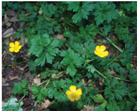
Cây Mao Lương Hoa Vàng Hoa màu vàng rực. Lan nhanh ở những chỗ ẩm ướt.