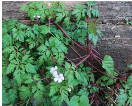
Thảo Mộc Robert (Stinky Bob) Cỏ dại có mùi với rễ dài, lan xa.