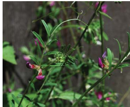
Đậu tằm Rất nhiều hạt nằm bên trong vỏ sau khi nở hoa.