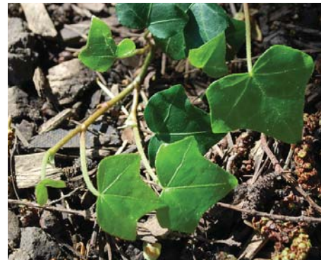
Cây Thường Xuân Giống dây leo phát triển nhanh.