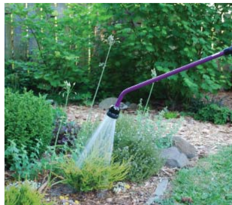
Riego: Riegue profundamente.