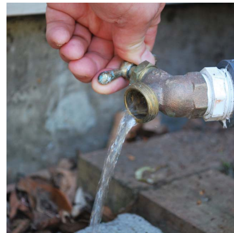
El riego de sus plantas: Sólo las cisternas llenas o casi llenas tendrán la suficiente presión para permitirle regar con una manguera.