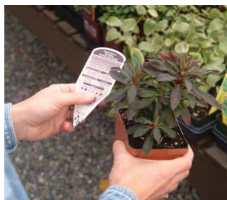
Planta: El otoño es la mejor época para reemplazar las plantas.