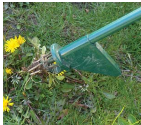
Maleza: Retire toda la maleza, incluyendo las raíces.

La basura y los desechos pueden obstruir las entradas y salidas. Limpie con regularidad cualquier sedimento, escombros o basura en el interior de su jardín pluvial. Revise el flujo cuando comiencen las lluvias en otoño y nuevamente en invierno.