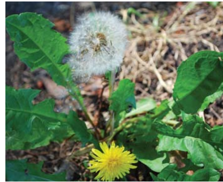
Diente de león Raíces largas y profundas.