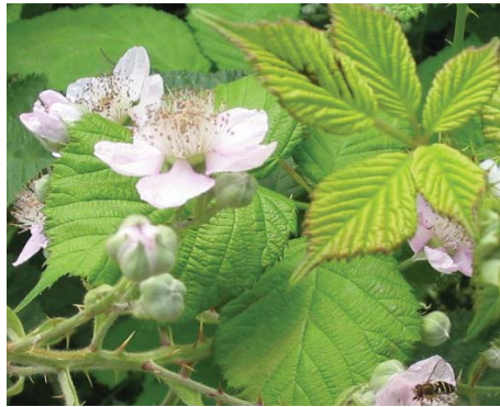
Zarzamora de Himalaya Parra con espinas y frutos negros de verano.

Vea una guía completa de malas hierbas comunes en www.portlandoregon.gov/bes/34598