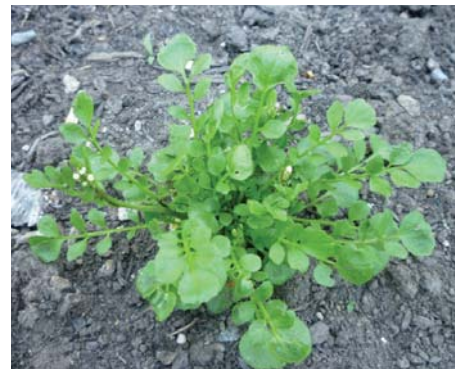
Cardamine hirsuta Las semillas se desprenden al menor contacto.