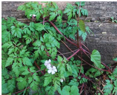
Geranio de Roberto (Stinky Bob) Maleza de olor fuerte con abundantes raíces largas.