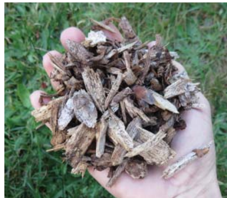
Acolchado: Coloque acolchado, como astillas de madera, sobre la superficie del suelo.