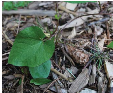
Enredadera (Gloria de la mañana) Flores blancas de la primavera hasta el verano.