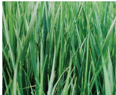
Pasto El pasto del césped circundante puede propagarse a su jardín y convertirse en la peor de las malezas.